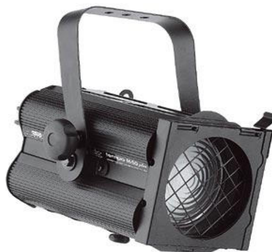
TEMPO F 650 PLUS